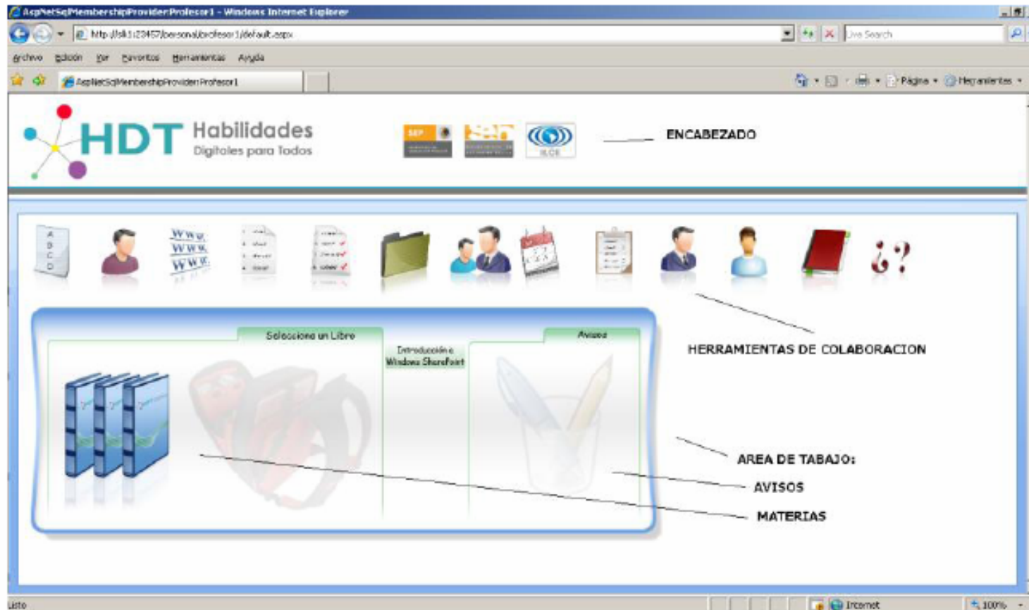
Figura 2.2 – Página principal del sistema Perfil Profesor.